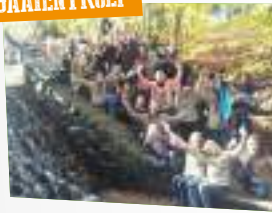
Weekendkamp in Loenen PAGINA 6