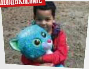
Dierendag PAGINA 7