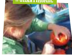
Pret met pompoenen PAGINA 9